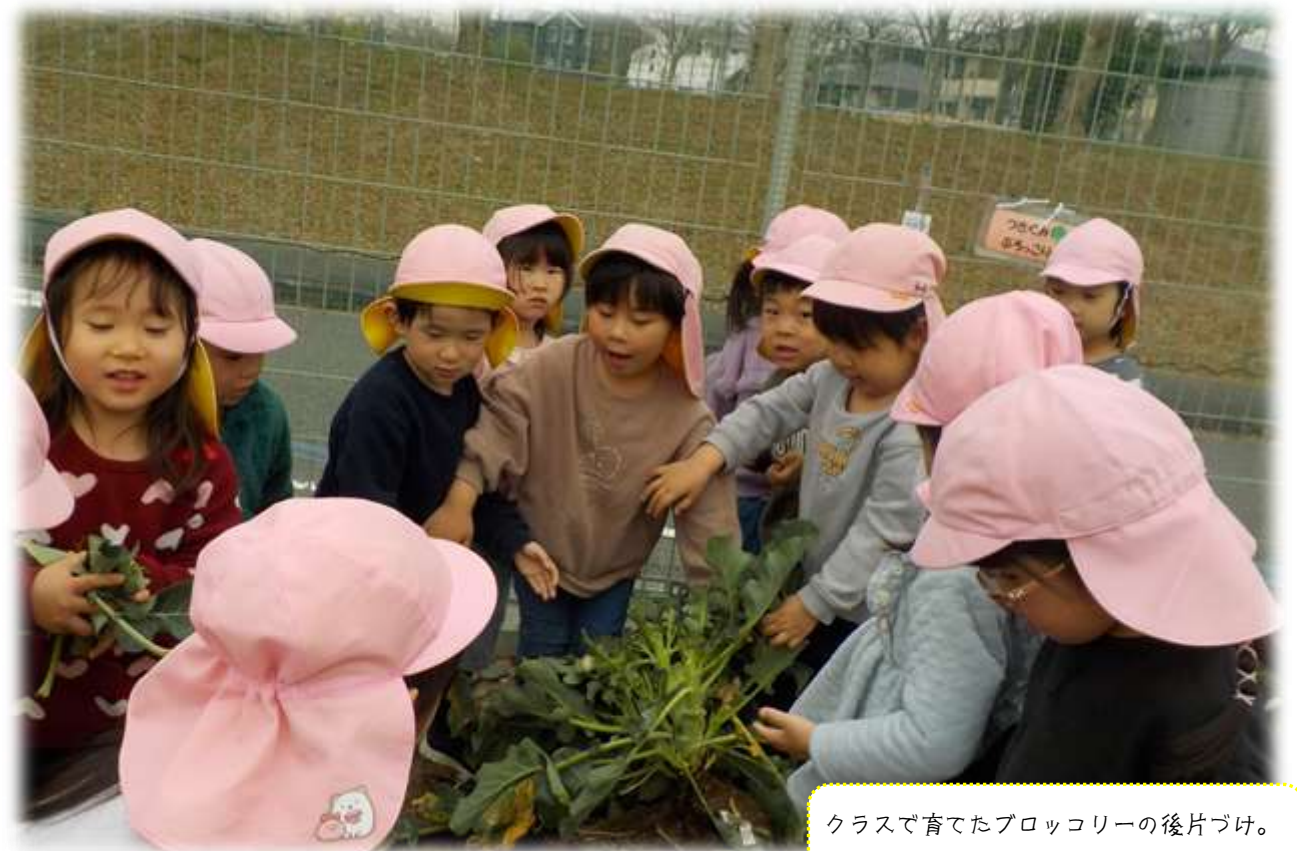
クラスで育てたブロッコリーの後片づけ。最後まで自分たちの手で...

https://ichounomori.okayamakodomokyoukai.jp/