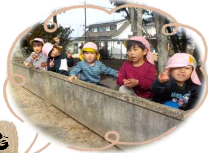
年明け初めての散歩へ。 春のように暖かい陽気でたくさん遊びました。

示してある模様と同じ模様を作るあそびです。こどもたちは「こうかな?」と見比べながらいろいろと考えながら作っています。